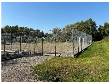
Figur 2-3. Foton från Strömkarlen.