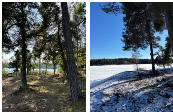
Figur 4-5. Foton från Strandparken.

Från gångstråket nås Strandparken som består av en udde med mjuka berghällar och uppvuxna tallar. I strandkanten växer vass. Parken erbjuder vackra vyer över Trehörningen, men saknar idag ordnade sittplatser.