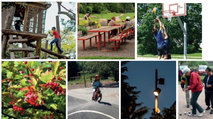
Figur 7-13. Referensbilder från programhandlingen.

Gestaltningen av parken har inspirerats av naturen och närheten till sjön Trehörningen, men också av sagoväsen och den nordiska folktron kopplat till parkens namn Strömkarlen – ett annat ord för Näcken. Temat präglar parkens utsmyckning och materialval.