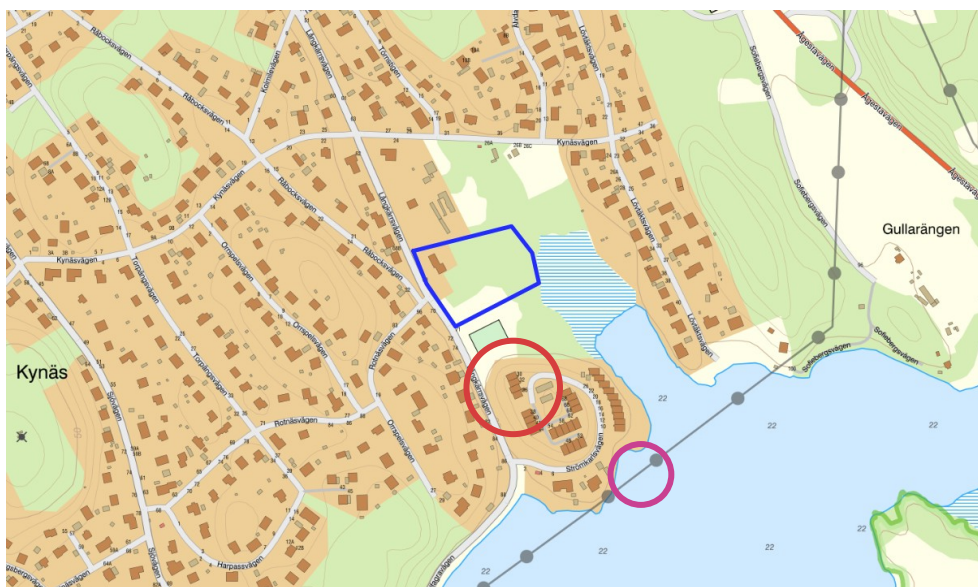
Figur 1. Röd cirkel visar Strömkarlen, lila cirkel visar Strandparken. Blå figur visar planområdet för Lotusen 3.

Norr om parkområdet ligger en privat fastighet, Lotusen 3, där det pågår arbete med att ta fram en ny detaljplan som möjliggör radhusbebyggelse.