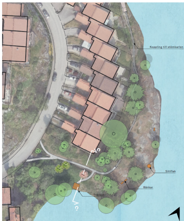
Figur 14. Programskiss för ny gestaltning av Strandparken.